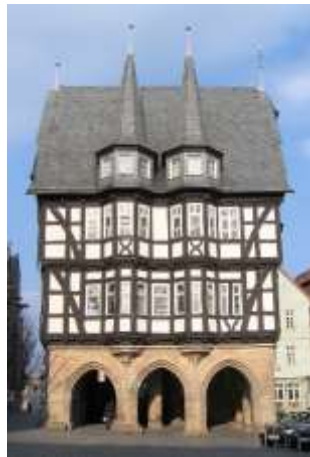
Das Alsfelder Rathaus

1512-1516 erbaut, erheben sich auf einem Sandsteinsockel zwei imposante Fachwerkgeschosse und ein Dachgeschoss. Der mit dem Bau des Fachwerkes beauftragte Meister Johann erbaute ab 1514 den Fachwerkoberbau und fügte zur Marktseite hin zwei symmetrisch über beide Geschosse reichende Erker an, die in Traufhöhe in zwei Erkertürmen mit Spitzhelmen fortgeführt wurden.